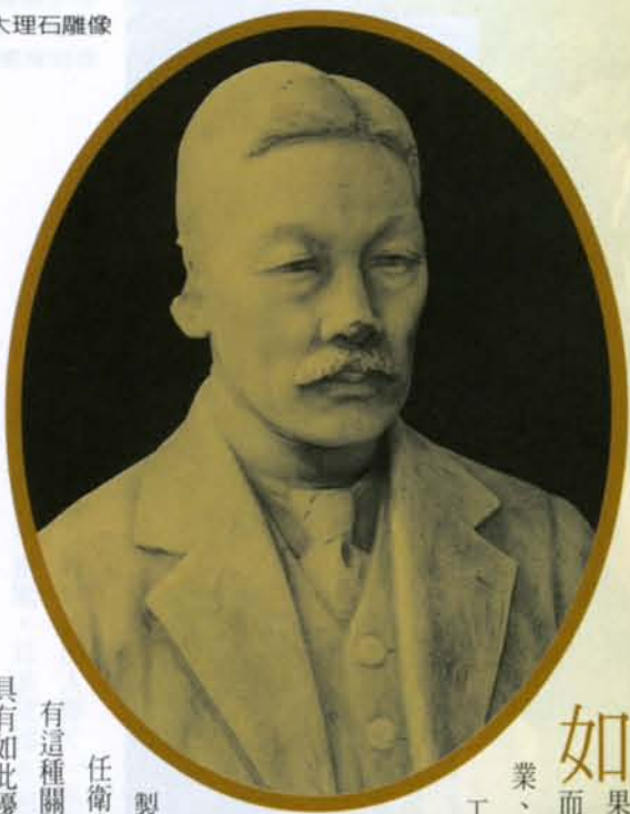
高木友枝博士大理石雕像